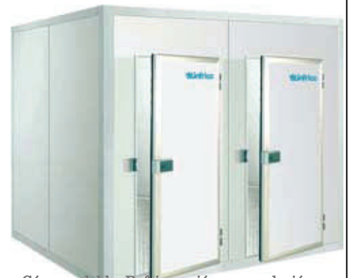
Cámara doble. Refrigeración y congelación